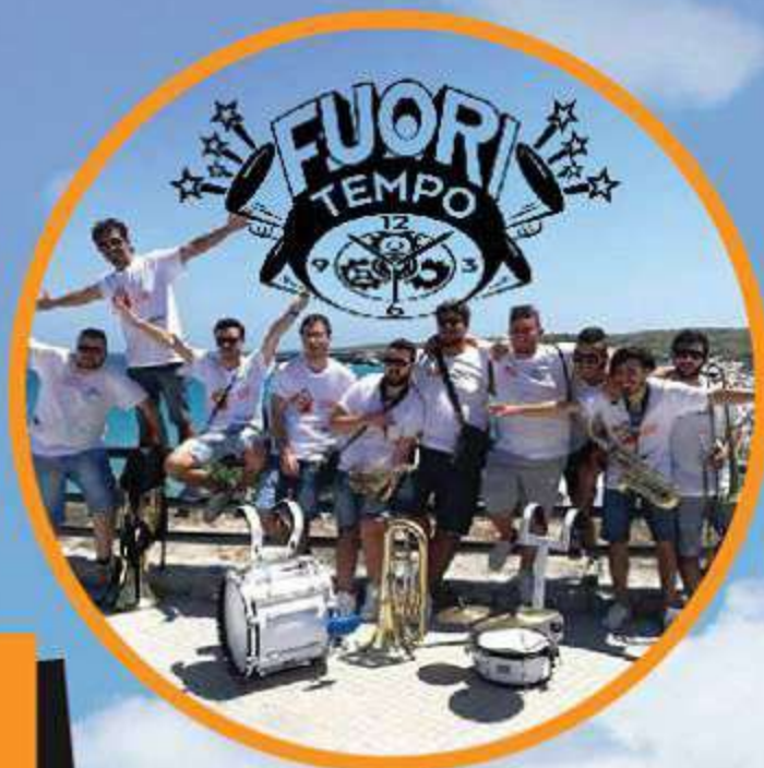
Musica dal vivo FUORI TEMPO Street band