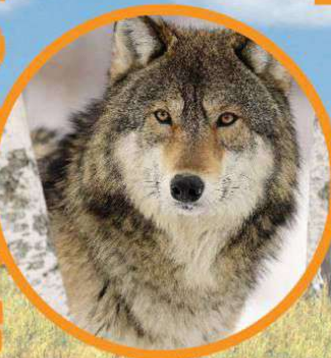
Special guests Lupi nordici