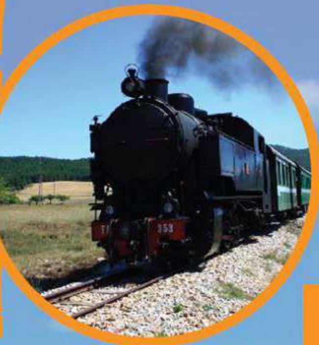
Servizio Turistico del Treno a vapore di Ferrovie della Calabria