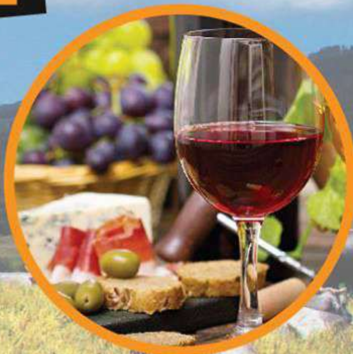
Degustazione di vini e prodotti tipici locali